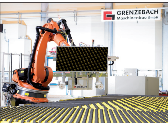
Am Ende der Fertigungsline nimmt ein Roboter das fertige Solar-Panel ab und stellt es für den Versand bereit.

Heute Teil 2 In einer kleinen Serie lesen Sie in unregelmäßigen Abständen über das weltweit agierende Unternehmen aus dem Donau-Ries