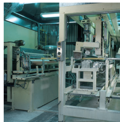
Секция нанесения растровым валиком