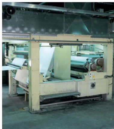
Секция пропитки с моторной регулировкой дозирующего валика