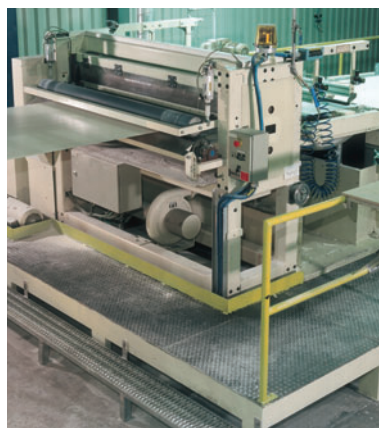
Устройство для поперечной резки рулона с выводом брака и устройством складывания в штабель