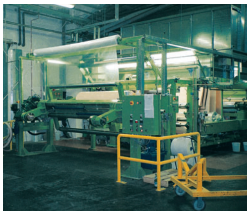
Безосевая размотка с гидравлическими подъезжающими рукавами