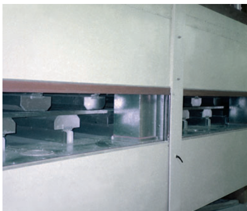
Аэрофонтанная сушилка с открытыми дверьми