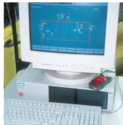
Управление установкой посредством SPS и визуализации установки