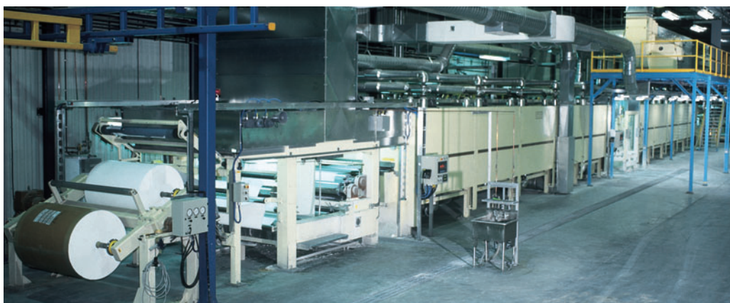
Установки пропитки для коротко тактовой плонки, двух-ступенчатая