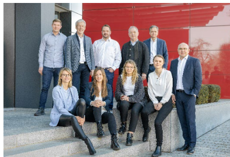
Envelon 团队，摄于 2022.3