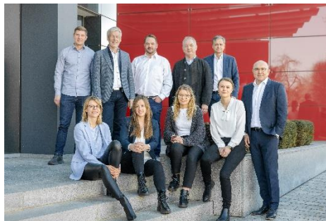
Das Team der Grenzebach Envelon GmbH (Stand: März 2022).